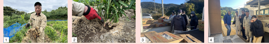
1.耕作放棄地甦りプロジェクトで栽培された無農薬の生姜 2.根元に育った生姜 3.収穫された生姜を受取りに 4.耕作放棄地甦りプロジェクトのみなさんと記念撮影

学問の神様「菅原道真」を祀る大隅パワースポットで有名です。[笑う一日]ラベルのモチーフになった神社で、ジンジャー(生姜)とかけています(笑)